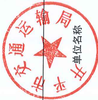
开平市交通运输局 2019 年度行政许可实施情况统计表