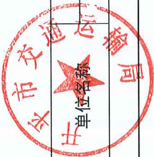
开平市交通运输局 2019 年度行政征收实施情况统计表