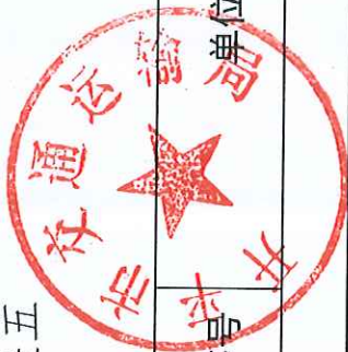
开平市交通运输局 2019 年度行政征用实施情况统计表