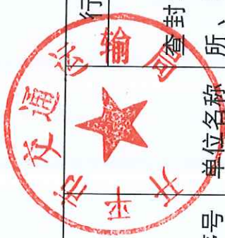
开平市交通运输局 2019 年度行政强制实施情况统计表